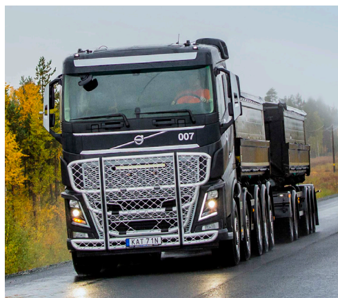
Storsatsning på säkrare vägar.