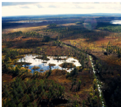
Sveriges största våtmarsrestaurering verkställs just nu av Kaunis Iron.